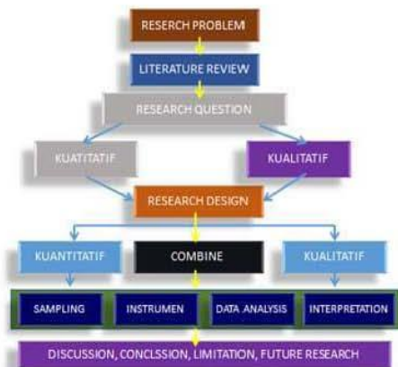
Gambar 3.1 Proses Penelitian Mixed Method